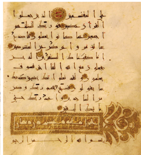
تصویر ۹. سرسوره «نحل» با نقش ایک در حاشیه به همراه نشان‌های فصل و عشر در میان سطور (راست) و نشان تقسیم هفت پاره قرآن به همراه نشان خمس در میان سطور (چپ)، مشهد: کتابخانه آستان قدس رضوی، ش ۵۰۱۳، برگ ۴۹ پ (راست). همان نسخه برگ ۳۴ ر.