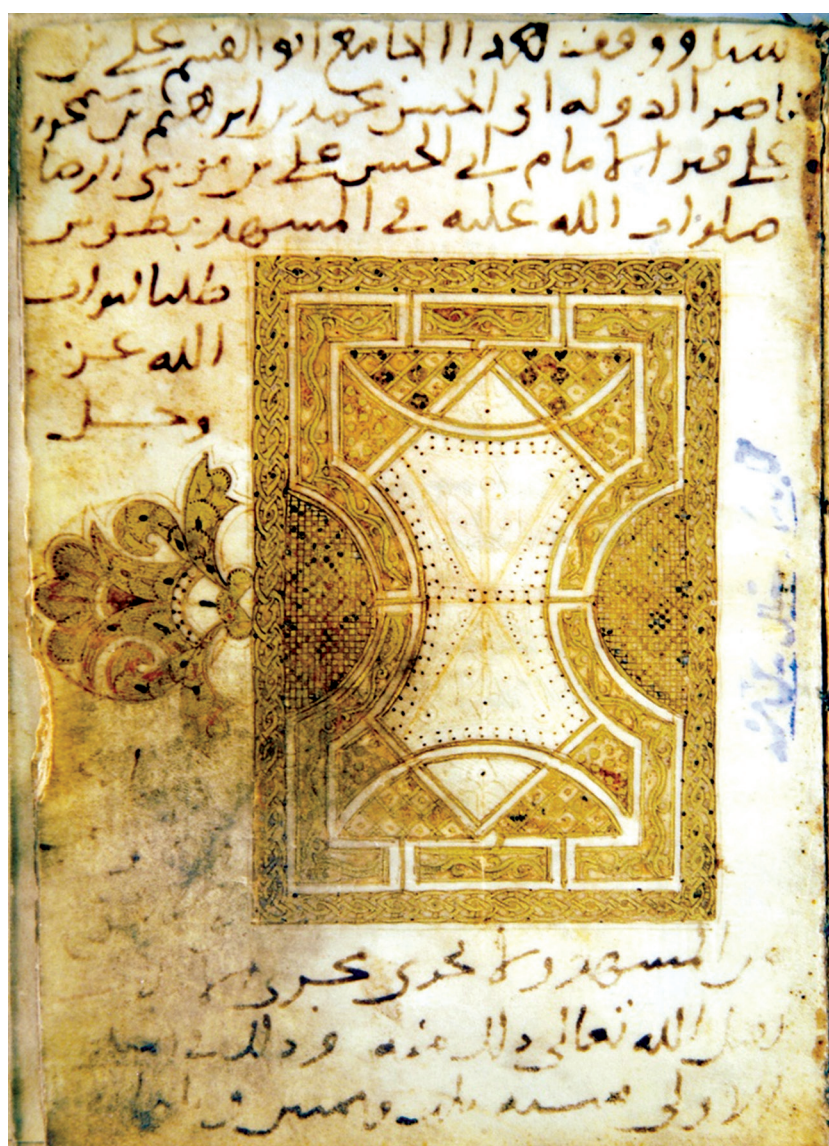
تصویر ۱. وقف نامه قرآن ۳۸۳ ق، مشهد: کتابخانه آستان قدس رضوی، ش ۳۰۴، برگ ۲. ن.

«سبل و وقف هذا الجامع ابوالقاسم علی بن / ناصرالدوله ابی الحسن محمد بن ابراهیم بن سیمجور / علی قبرا الامام ابی الحسن علی بن موسی الرضا / صلوات الله علیه فی المشهد بطوس / طلبا لثواب / الله عزوجل / ... / من المشهد ولا تجری مجری / ... / تقبل الله تعالی ذلك منه و ذلك فی / ... / الاولی سنه ثلث و ثمنین و ثلثمئه».