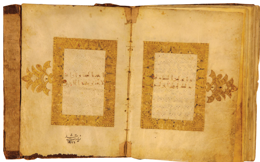
تصویر ۸. صفحات پایانی پاره چهارم با حاشیه ضخیم مزین به نقش مروارید و گلبرگ‌های زرین، شماره ۳۰۰۴، برگ ۴۹ پ-۵۰ ر.