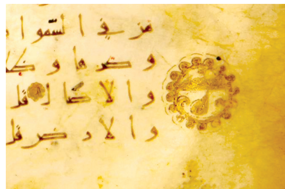
تصویر ۱۰. نشان سجده در حاشیه برگی از پاره پنجم، همان نسخه، برگ ۱۹ پ.

در رو و پشت جلد و همچنین بر روی طبله نقشی تزئینی انداخته‌اند. فن اجرای این نقش مانند تمامی جلدهای این دوره از نوع ضربی است. تمامی جلدهای موجود از نسخه‌های سده چهارم هجری به این فن آراسته شده است. مانند قرآن کشواد بن املاس (کتابخانه آستان قدس رضوی، ۳۰۱۳) و قرآن وقفی ابن کثیر (کتابخانه آستان قدس، ش ۲۸۲).