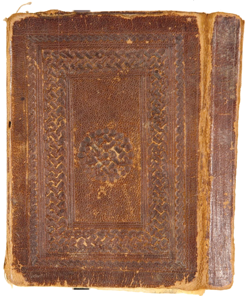
تصویر ۱۱. نقوش روی جلد قرآن سیمجور، با نقش متن و حاشیه زنجیری. جلد پاره پنجم، شماره ۵۰۱۳.

کیفیت والای اجزای این نسخه از جمله خط دقیق و سبک‌دار، تذهیب پرکار و تماماً زر، و استفاده از پوست به جای کاغذ حاکی از تهیه این نسخه در یک نظام درباری منسجم است. جایگاه واقف آن، در مقام سپهسالار خراسان و حاکم نیشابور بر اهمیت این نسخه می‌افزاید.