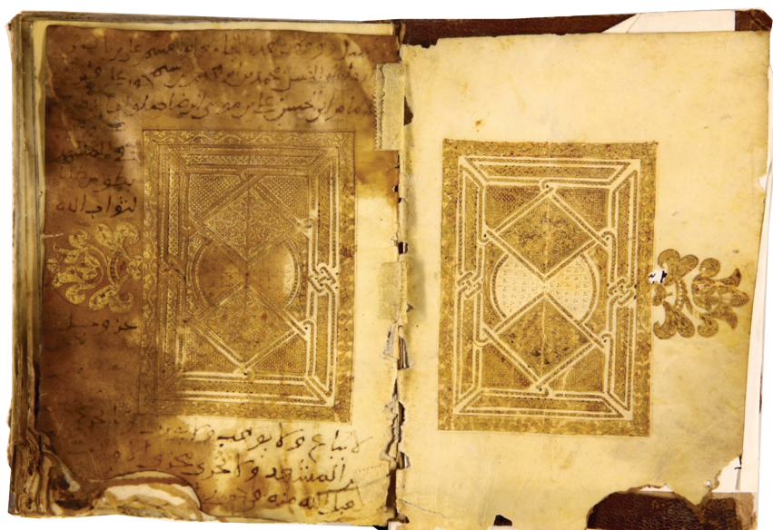
تصویر ۷. الواح آغازین قرآن ۳۸۳ ق، ش ۵۰۱۳، مشهد: کتابخانه آستان قدس رضوی، برگ اب-۲ ر.