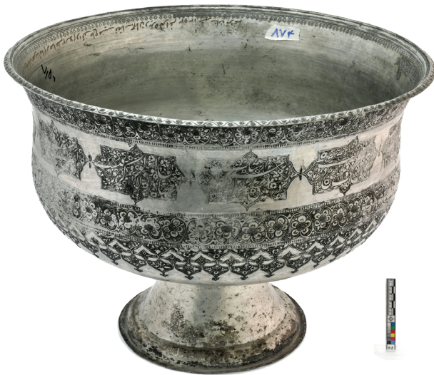
تصویر ۱۸. نقوش گیاهی و گل های پنج پر بر زمینه دوستکامی شماره ۶/۵۱۸۰۲

۲-۳-۱-۳. نقوش گیاهی: نقوش گیاهی (اسلیمی و ختایی): نقوش گیاهی واقعی به کار رفته در تزئین دوستکامی های حرم امام رضا علیه السلام شامل: نقش درخت سرو، گل های همیشه بهار و گل های ساده پنج پر (پنتوس) است که به خصوص گل پنج پر، بر بیشتر این دوستکامی ها تجسم یافته و ساقه هایشان گاه مانند پیچک های اسلیمی بر زمینه نقش بسته و با خطوط کتیبه ها درآمیخته. گل های پنج پر به صورت شاخه ای با ساقه های متصل و تک گل با ساقه های مدور و یا به صورت دسته گل نقش شده و در دوستکامی های مصور قاب قابی بر زمینه گل افشان درهر قاب دیده می شود.