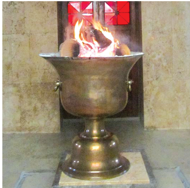
تصویر ۲. آتشدان در آتشکده بهرام یزد در شهرستان یزد

از نمونه آثار قابل مقایسه با فرم ظروف دوستکامی مورد بحث در این مقاله، ظرف آتشدان موجود در آتشکده‌های زرتشتیان در شهر یزد و عبادتگاه‌های اطراف آن مانند چک چک است که فرمی مشابه دارند.