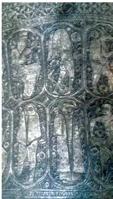
تصویر ۱۴. نقوش انسانی بردوستکامی شماره ۶/۵۱۸۰۱

دیده می‌شود. سه گل پنج‌پر نیز مقابل روی او قرار دارد. بر بدنه دوستکامی بدون شماره نیز نقش پیکره‌هایی در حال انجام کارهای مختلف محصور در قاب بندی اجرا شده است. بدن و صورت این پیکره‌ها سه رخ است و از لحاظ طرز طراحی به شیوه نگارگری عصر صفوی شباهت دارند. نقش این پیکره‌ها که ایستاده یا نشسته درون قاب‌هایی متنوع در چهار دوستکامی مورد بررسی در کنار هم آمده، در مجموع سؤالی را طرح می‌کند که آیا نقوش انسانی این آثار دارای بیان روایی بوده یا صرفاً کاربردی تزئینی داشته، که البته جای بررسی بیشتری دارد.