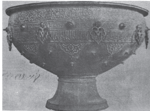
تصویر ۴: ظرف دوستکامی مفرغی جامع هرات، موزه ارمیتاژ، (احسانی، ۱۳۸۲: ۱۶۱)

۱. این سنگاب که پس از توسعه صحن عتیق و ساخت سقاخانه در میانه صحن، دیگر کاربرد اولیه را نداشته، به مرور در توسعه حرم در میانه رواق‌های زیارتی قرار گرفته بود. با ساخت اولین موزه آستان قدس رضوی، پس از مرمت به این موزه منتقل شد و تاکنون در معرض نمایش قرار دارد.