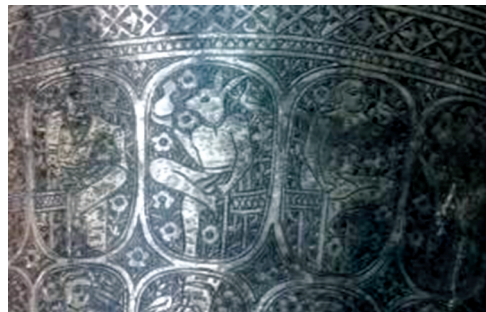
تصویر ۱۹. نقش موجود خیالی بر دوستکامی ش ۶/۵۱۸۰۵