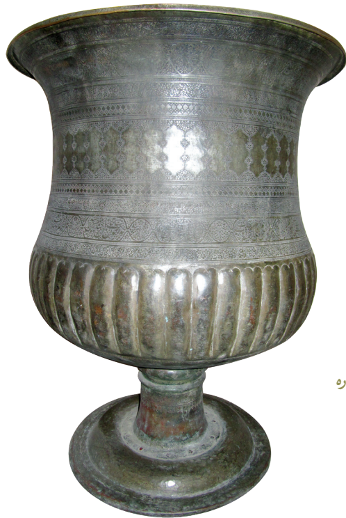
تصویر ۸. دوستکامی شماره ۶/۵۱۷۹۵ (آرشیواداره مطالعات و معرفی موزه آستان قدس رضوی)

این دسته از اشعار را بر روی دو دستکامی‌های به شماره‌های ۶/۵۱۷۹۸ و ۶/۵۱۷۹۵ که به سفارش مرتضی قلی پیش خدمت ساخته شد، به قلم نستعلیق خوش و هنرمندانه نوشته و با مهارت تمام قلم‌زنی کرده‌اند. از نظر ظرافت خط و اجرای آن بر فلز این کتیبه‌ها با نمونه‌های نقش شده بر سایر ظروف این مجموعه قابل مقایسه نیست و از مهارت سازنده آن حکایت می‌کند. محتوای کتیبه‌های این دو اثر متفاوت است. برخی ابیات در وصف ظرف است که واژگان، «دوستکامی»، «دوستکانی» و «سقاخانه» در آن‌ها به کار رفته و نشان‌دهنده کاربرد آن است. ابیاتی نیز به وصف مقام اجتماعی و سیاسی تولیت وقت و گزارشی از حضور او در مشهد اختصاص دارد. ابیات پایانی نیز دربردارنده نام سازنده، بانی، کاتب، و شاعر و تاریخ اثر در قالب ماده تاریخ است. ۱