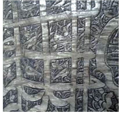
تصویر ۱۵. نقش پرندگان بر شاخه گل در میان عبارت «بسم الله» در دوستکامی ش ۶/۵۱۸۰۱

۲-۳-۱-۳. نقوش گیاهی: نقوش گیاهی (اسلیمی و ختایی): نقوش گیاهی واقعی به کار رفته در تزئین دوستکامی های حرم امام رضا علیه السلام شامل: نقش درخت سرو، گل های همیشه بهار و گل های ساده پنج پر (پنتوس) است که به خصوص گل پنج پر، بر بیشتر این دوستکامی ها تجسم یافته و ساقه هایشان گاه مانند پیچک های اسلیمی بر زمینه نقش بسته و با خطوط کتیبه ها درآمیخته. گل های پنج پر به صورت شاخه ای با ساقه های متصل و تک گل با ساقه های مدور و یا به صورت دسته گل نقش شده و در دوستکامی های مصور قاب قابی بر زمینه گل افشان درهر قاب دیده می شود.