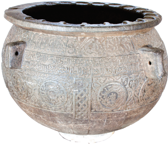
تصویر ۳: سنگاب تاریخی حرم امام رضا علیه السلام ، اوایل قرن هفتم هجری، موزه آستان قدس رضوی، آرشیواداره مطالعات و معرفی آثار موزه رضوی

یک نمونه کهن و جالب توجه از ظروف پایه‌دار و جام شکل، دوستکامی مفرغی، مربوط به دوره تیموری است که در محل گور امیر تیمور نصب بوده و در حال حاضر در موزه ارمیتاژ نگهداری می‌شود. این دوستکامی تاریخی که از نظر فرم با دوستکامی‌های مورد بررسی در این مقاله و از نظر کاربرد با سنگاب تاریخی حرم امام رضا علیه السلام قابل قیاس است، توسط هنرمندان ایرانی ساخته شده و به طور مشخص کارکرد سنگاب یا ظرفی داشته است؛ به این اعتبار که در آن آب می‌ریخته‌اند تا جمعیت حاضر در آن مکان به فراخور نیاز برای نوشیدن یا تطهیر از آن استفاده کنند. ۲ (احسانی، ۱۳۸۲: ۱۵۹) (تصویرش: ۴)