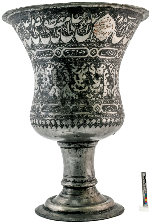
تصویر ۹. کتیبه وقف و تاریخ بردوستکامی ش ۱۰۱۵.

۲-۳-۲. کتیبه‌های تاریخی: متن این کتیبه‌ها به ضبط نام واقف، تاریخ وقف و گاه تاریخ ساخت اثر اختصاص دارد. در دوستکامی‌ها این کتیبه‌ها را اغلب به قلم نسخ و گاه نسخ آمیخته به ثلث، و در برخی نیز به قلم نستعلیق در مواضع مختلفی از ظروف کتابت کرده‌اند. صنعتگران در حین ساخت ظروف مسی و برنجی که از قبل و بدون دریافت سفارش تهیه می‌شد معمولاً درون یک یا چند ترنج بالای ظرف را جهت ثبت نام سفارش‌دهنده بدون تزئین رها می‌کردند. محل درج کتیبه وقف در ظروف متفاوت است. در برخی دو ترنج در دو طرف بسم‌الله نقش شده که در آن کتیبه وقف و نام واقف و تاریخ اثر حک شده است. مثلاً در دوستکامی شماره ۶/۵۱۷۹۷ «دو» در یک ترنج و «ستکامی» در ترنجی دیگر نوشته شده و سال ساخت اثر خالی مانده است و در زمان وقف ظرف، واقف در ترنج خالی ماند دارد. در برخی نیز این ترنج‌ها در زمان ساخت اثر خالی مانده است و در زمان وقف ظرف، واقف در ترنج خالی ماند دوستکامی شماره ۱۰۱۵ (تصویرش ۸) یا قسمت دیگری مانند لبه‌های داخل ظرف یا روی پایه متن تاریخ وقف را ذکر کرده است. این نوع کتیبه را در دوستکامی ۶/۵۱۷۹۹ می‌توان مشاهده کرد. ۲ تاریخ ساخت اثر در این ظرف در انتهای صلوات خاصه به صورت «سنه ۱۲۸۳» ضبط شده است.