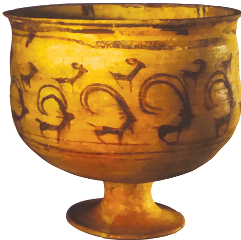
تصویر ۱. ظرف سفالین با نگاره بز، هزاره سوم پیش از میلاد، شهرسوخته، بیگری و عبدی.

در بین آثار سفالین و سنگی به دست آمده از محوطه‌های تمدن باستانی فلات ایران نمونه‌های متعددی از این فرم ظروف در ابعاد مختلف دیده می‌شود که بیشتر آن‌ها منقوش هستند. واندنبرگ در کتاب باستان‌شناسی ایران باستان نمونه‌های متنوعی را از ظروف سفالی پایه‌دار و منقوش، مکشوفه در تپه حصار و تپه سیلک بررسی و شناسایی کرده است (واندنبرگ، ۱۳۷۹، ۱۳ و ۱۲۷ و ۱۲۸؛ بیگری و عبدی، ۱۳۹۳: ۴۲ و ۵۴) اما آنچه که تاکنون پژوهشگران باستان‌شناسی و تاریخ هنر بر آن تحلیلی نداشته‌اند این است که این ظروف پایه‌دار بسیار زیبا که نقوش آن نشانه نحوه نگرش انسان پیش از تاریخ به زندگی و الهامات او از طبیعت است آیا کاربردی آیینی هم داشته‌اند؟