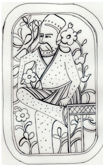
تصویر ۱۳. نقش انسانی بردوستکامی ش ۶/۵۱۸۰۵ - جهان‌پور، ۱۳۸۰

۲-۱-۳-۲. نقوش حیوانی: این نقش‌ها تجسم واقعی پرندگانی مانند لک‌لک و جانورانی مانند آهواست که بر بدنه دوستکامی‌ها یا در لابلای کتیبه‌ها قلم‌زده شده‌اند. شمار قابل توجهی از آن‌ها نقش پرندگانی است که به صورت منفرد در قاب یا در حاشیه قاب‌ها به صورت نشسته بردست یا شانه افراد و یا لابلای شاخ و برگ گل‌های تزئینی بر زمینه خطوط ثلث اجرا شده‌اند. به طور مثال در میان عبارت «بسم الله» در دوستکامی ش ۶/۵۱۸۰۱ نقش لک‌لک با گردنی بلند و شاهین مشاهده می‌شود. (تصویرش: ۱۴) دسته دیگر نقش حیواناتی مانند کبوتر، آهو، خرگوش، سگ، کفتار یا گرگ، اسب، قاطر، گربه، و پلنگ یا یوزپلنگ، میمون و شترمرغ است که در برخی قاب بندی‌ها به طور منفرد و در برخی در ارتباط با انسان‌ها هستند.