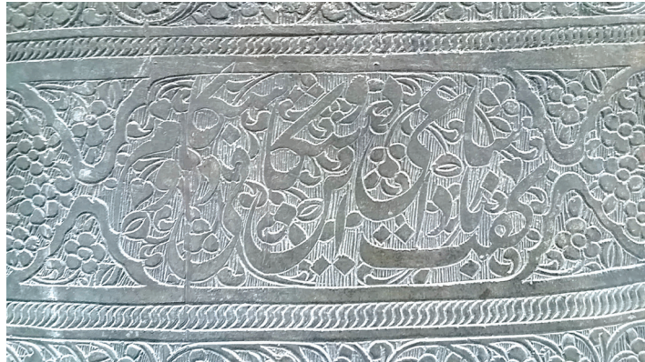
تصویر ۱: کتیبه ماده تاریخ «گفت بادا ساعی این دوستکانی دوستکام» بر دوستکامی شماره ۶/۵۱۷۹۵

در دوستکامی شماره ۶/۵۱۷۹۵ ماده تاریخ در کتیبه شعری به ابجد نوشته شده است: «گفت بادا ساعی این دوستکانی دوستکام». (تصویرش: ۹)