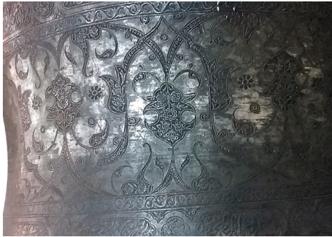
تصویر ۲۳. نقش گل همیشه بهار و ختایی به شیوه سیاه قلم، بر زمینه دوستکامی ش ردیف ۵۱۸ / ص ۴۰ (دفتراموالی خزانه موزه رضوی)

۲-۳-۳. نقوش تزئینی: این نقوش بر دو دسته تقسیم می‌شوند: ۲-۳-۳-۱. نقوش انتزاعی: این نقوش شامل نقوش اسلیمی و گل‌های ختایی است که مطابق روش مرسوم نقوش سنتی طراحی شده و تزئین بخشی از بدنه ظروف را در بر می‌گیرد.