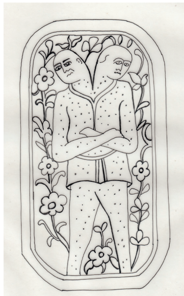
تصویر ۲۰. نقش انسانی با دو سر بر دوستکامی ش ۶/۵۱۸۰۵ جهان‌پور، ۱۳۸۰

۲-۳-۲. نقوش خیالی یا اسطوره‌ای: استفاده از نقوش خیالی و اساطیری در هنرهای تزئینی دوره قاجار رواج چشمگیری داشت. در میان دوستکامی‌های مجموعه آستان قدس رضوی نیز در تزیین چهار اثر به شماره‌های: ۶/۵۱۸۰۱-۶/۵۱۸۰۵-۶/۵۱۷۹۷ و بدون شماره، نقوش انسانی و حیوانی اساطیری یا خیالی به کار رفته است. این دسته شامل نقش مردانی با سر حیوان یا پرندگان است که ایستاده یا بر صندلی نشسته‌اند. همچنین نقش اشخاصی با هیبت دیو که دارای دو شاخ کوتاه بر روی سر، با بدن خال خالی، دیده می‌شود. نقش حیوانی با سر انسان، موجوداتی با هیكل انسانی دارای یک پا و بدن خال خال با پوزه کشیده، نقش گریفن و اسفنگس که گاه فردی سوار بر آن است. همچنین نقش انسانی با دو سر و یک بدن که بدن و لباسش خال خالی است تصویر شده (تصویر ش: ۱۹) زمینه این قاب‌ها با نقوش گیاهی و گل‌های پنج پرآراسته شده است. این نقوش که بربله ظروف تا انتهای بدنه بیرونی یا محل اتصال آن به پایه را در بر گرفته، نشان می‌دهد که ابتدا نقش و کتیبه بر روی ورقه مس اجرا شده، سپس از آن برای ساخت این ظروف استفاده شده است. در شیوه قلم‌زنی بر این آثار زمینه کار را سیاه قلم کرده‌اند تا نقش‌ها و قاب آن‌ها برجسته و نمایان باشد.