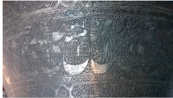
تصویر ۲۲. پیچک‌های اسلیمی بر زمینه دوستکامی ش ردیف ۵۱۸ / ص ۴۰ (دفتراموالی خزانه موزه رضوی)