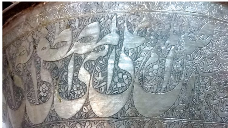
تصویر ۶. کتیبه صلوات بر دوستکامی شماره ۶/۵۱۸۰۳، به قلم نستعلیق، قلم زنی، ۱۲۸۶ ق. (کفیلی، ۱۳۹۷)

۲-۲-۱. صلوات بر چهارده معصوم: صلوات بر چهارده معصوم علیهم السلام ۲ یکی از متون رایج در کتیبه‌نگاری است و مستقیماً با عقاید شیعه مرتبط است. در برخی از اشیا که به متنی طولانی نیاز باشد صلوات بر چهارده معصوم و متونی مشابه را کتابت می‌کنند. سطح بیرونی دوستکامی‌ها به سبب اندازه بزرگ ظرف، فضایی را در اختیار کاتب می‌گذارد که با متن نسبتاً طولانی صلوات چهارده معصوم متناسب است. از این روست که این متن بر هشت مورد ۳ از سیزده دوستکامی مورد بحث که مربوط به عصر قاجار در حرم امام رضا علیه السلام هستند، کتابت شده است. گفتنی است گاه در انتهای این متن تاریخ ساخت اثر نیز ذکر شده مانند نمونه ش ۶/۵۱۷۹۹ که پس از صلوات تاریخ ساخت، «سنه ۱۲۸۳»، آمده است.