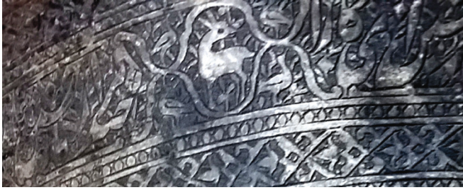
تصویر ۱۶. نقشی شبیه به آهو و تکرار نقش لک لک و شاهین بر دوستکامی ش ۶/۵۱۸۰۵