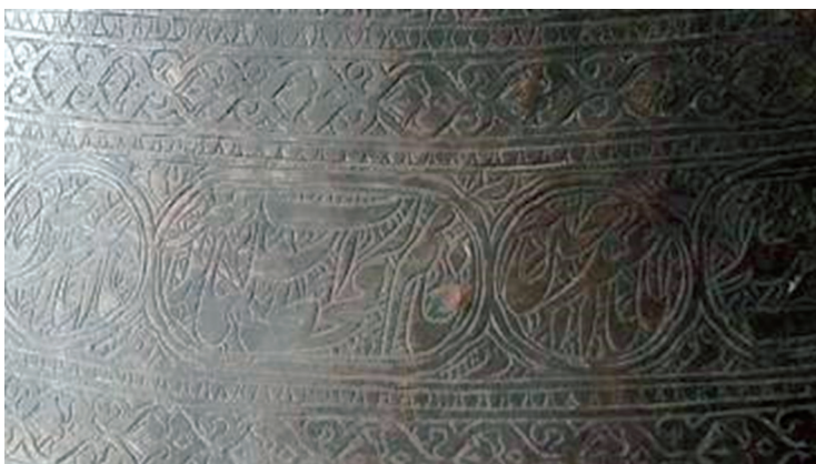
تصویر ۷. عبارت «یا ابا عبدالله حسین» و بیتی از ترجیع‌بند محتشم کاشانی «خاتم زحط آب سلیمان کربلا» بر دوستکامی شماره ۶/۵۱۷۹۷

۲-۲-۲. اشعار: اشعار فارسی در کتیبه‌نگاری عموماً به قلم نستعلیق کتابت می‌شد و جهت سهولت در تنظیم ترکیب بندی و همچنین خوانایی بیشتر هر مصرع در ترنجی مجزا قرار می‌گیرد. کتیبه‌های اشعار برخی دوستکامی‌های آستان قدس رضوی عموماً کیفیت کتابت درخوری ندارند و در متن‌شان نیز گاه کلمات به هم متصل شده‌اند یا حروفی جا افتاده و کتابت نشده است. نوع اشعار به کار رفته در دوستکامی‌های آستان قدس رضوی دو گونه است. یکی اشعار شاعران معروف مانند غزلیاتی از حافظ شیرازی ۱ و ابیاتی از ترجیع‌بند معروف محتشم کاشانی ۲ ، در وصف واقعه کربلا، که به قلم نستعلیق است و دیگر اشعاری است که مشخصاً درباره همان اثر سروده شده است.