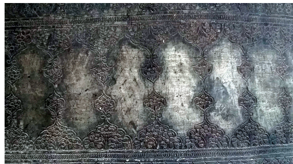
تصویر ۲۴. نوارهای تزئینی نقوش انتزاعی، نیم‌ترنج‌های شرفه‌دار بردوستکامی ش ۶/۵۱۷۹۵.

۲-۳-۳-۲. نقوش نواری جداکننده: این نقوش که به صورت نوارهای افقی بر سطح ظروف طراحی و اجرا شده‌اند شامل حاشیه‌ها و قاب‌های نقش بسته بردوستکامی‌ها برای تفکیک فضای کتیبه‌ها و نقوش بر سطح وسیع ظرف طراحی شده‌اند. این قاب‌ها عموماً به شکل ترنج بازوبندی و قلمدانی، بیضی، خانه‌بندی، نوارهای افقی تفکیک‌کننده با پهنایی بین پنج میلی‌متر تا حدود دو سانتی‌متر اجرا شده‌اند. در برخی از دوستکامی‌ها به سرترنج‌های تزئینی شرفه نیز افزوده شده که در تکمیل تزئینات بسیار مؤثر بوده است.