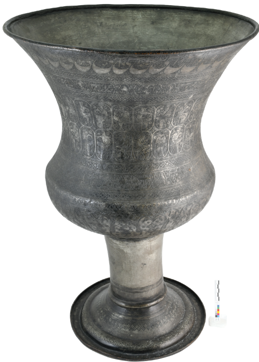
تصویر ۱۲. چگونگی استفاده از نقوش در تزئین دوستکامی ش ۶/۵۱۸۰۵

دوستکامی‌ها به مانند بسیاری دیگر آثار دوره اسلامی دارای نقوش تزئینی متنوعی است. در برخی از آن‌ها تمام سطح ظرف با استفاده از نقوش مختلف پوشانده شده به طوری که هیچ فضای خالی در زمینه به چشم نمی‌خورد. برای نمونه بر دوستکامی شماره ۶/۵۱۸۰۵ و شماره ۶/۵۱۷۹۷ می‌توان دید که بدنه ظرف به طور کامل تا محل اتصال به پایه با نقوش متنوع آراسته شده است. (تصویرش ۱۱) این نقوش که اشکال ساده شده و تجریدی عناصر مختلفی از طبیعت است شکل و معنایی متفاوت دارند که در اینجا به سه دسته شامل نقوش واقعی، خیالی، و تزئینی تقسیم می‌شود.