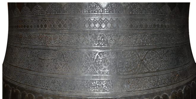
تصویر ۲۵. قاب کتیبه با طرح ترنج بازوبندی و خطوط تزئینی جداکننده نقوش و خطوط، دوستکامی ش ۶/۵۱۷۹۵.

۲-۳-۳-۲. نقوش نواری جداکننده: این نقوش که به صورت نوارهای افقی بر سطح ظروف طراحی و اجرا شده‌اند شامل حاشیه‌ها و قاب‌های نقش بسته بردوستکامی‌ها برای تفکیک فضای کتیبه‌ها و نقوش بر سطح وسیع ظرف طراحی شده‌اند. این قاب‌ها عموماً به شکل ترنج بازوبندی و قلمدانی، بیضی، خانه‌بندی، نوارهای افقی تفکیک‌کننده با پهنایی بین پنج میلی‌متر تا حدود دو سانتی‌متر اجرا شده‌اند. در برخی از دوستکامی‌ها به سرترنج‌های تزئینی شرفه نیز افزوده شده که در تکمیل تزئینات بسیار مؤثر بوده است.