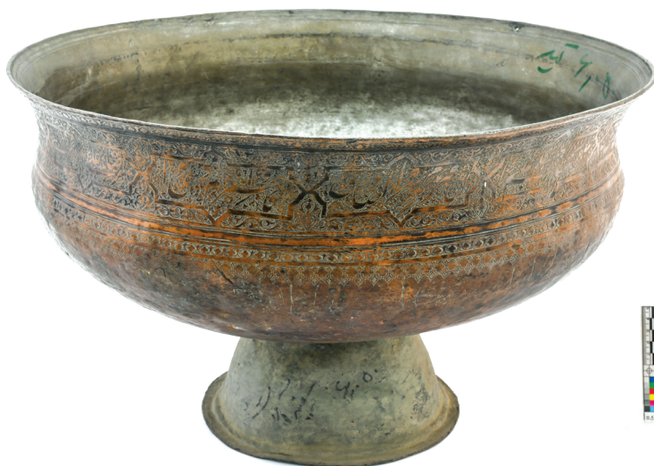
تصویر ۱۱. دوستکامی مسی با تاریخ‌های ۱۱۷۸ و ۱۲۰۵ ق و کتیبه وقف به تاریخ ۱۳۸۲ ش. در داخل ظرف

۲-۲-۴. سایر کتیبه‌ها: این کتیبه‌ها شامل نام «ابا عبدالله حسین» و دیگر کلمات مرتبط با محتوای اشعار در ترنج‌هایی کوچک بین قاب‌های قلمدانی حاوی کتیبه اصلی درج شده است. در برخی نیز اعداد و حروفی دیده می‌شود که احتمالاً پس از ساخت اضافه شده است. مثلاً در یکی از دوستکامی‌هایی که خارج از محدوده‌ی تحقیق مورد بررسی قرار گرفته تاریخ‌های ۱۱۷۸ و ۱۲۰۵ ق و داخل ظرف نیز کتیبه وقف با سال ۱۳۸۲ ش درج شده است. گفتنی است در این دوستکامی سبک اجرا و شیوه طراحی نقوش با ظروف سده سیزدهم شباهت نزدیکی دارد. (تصویر، ش ۱۵)