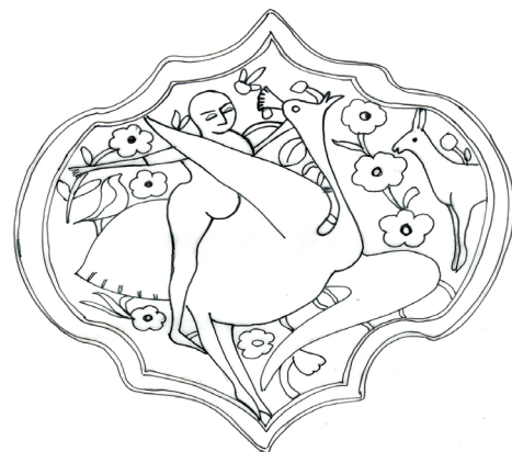
تصویر ۲۱. نقش انسانی سوار بر حیوانی با سر طاووس و بدن شتر مرغ در حال جهش در مرغزاری پر از گل‌های پنج پر، در جلو آهو و در پشت پرنده‌ای در زمینه گل‌ها نقش شده. نقش شده بر دوستکامی شماره ۶/۵۱۷۹۷. جهان‌پور، ۱۳۸۰